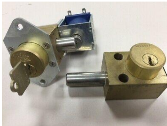
Imagem 2. Sistemas de Intertravamento Kirk Key Interlock®

A segurança das instalações elétricas conta com recursos técnicos extremamente valiosos, mas ainda é necessário avançar na conscientização de quem decide dentro das empresas, para que estes recursos possam ser mais aplicados, reduzindo assim a níveis extremamente baixos os acidentes causados pela eletricidade.