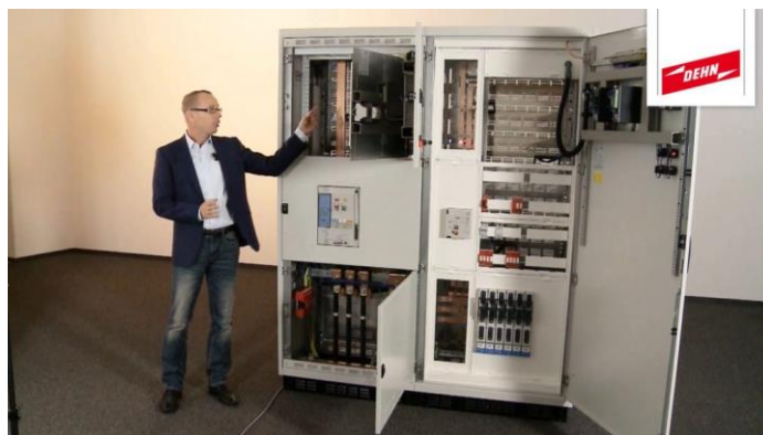
Imagem 3. Sistema de proteção contra arcos elétricos DEHNshort®¹.