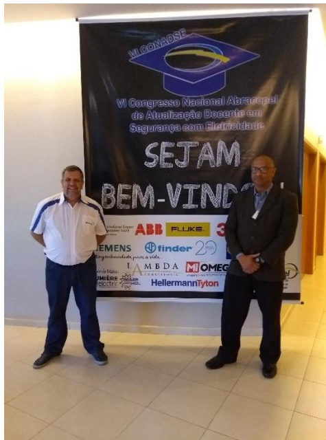
Imagem 3. A Lambda Consultoria deseja para todos um feliz natal e um ótimo 2019, agradecendo todo o apoio e confiança recebidos em 2018.