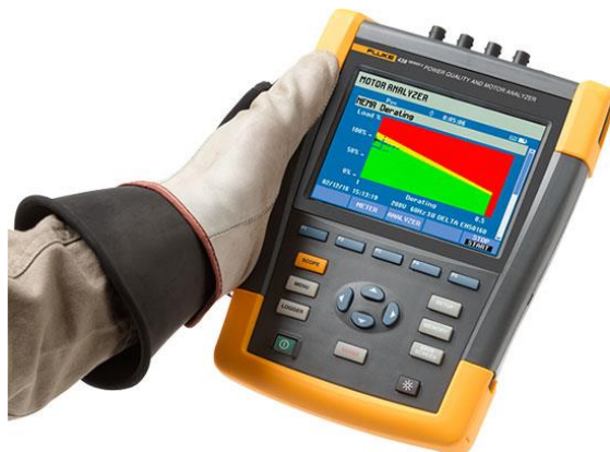
Imagem 3. Analisador de qualidade de energia utilizado pela Lambda Consultoria.

Além dos benefícios da redução de acidentes, a melhoria da segurança das instalações elétricas também contribui para que as empresas aumentem a sua produtividade, reduzindo os custos com interrupções não programadas e o desperdício de energia.