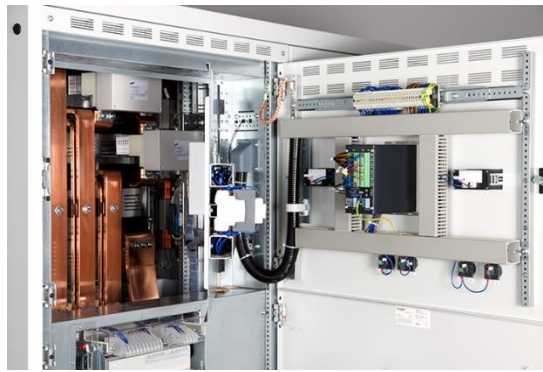
Imagem 2. Equipamento de proteção contra arcos elétricos DEHNshort®.

Através das normas regulamentadoras do ministério do trabalho, as NRs, existe no Brasil base legal suficiente para que as empresas considerem a segurança uma prioridade. Tecnicamente também temos todo o conhecimento necessário para que os riscos de acidentes de origem elétrica sejam significativamente reduzidos.